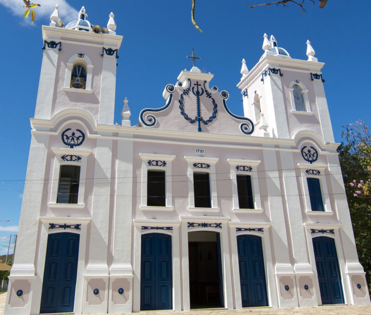
Igreja Nossa Senhora do Ó - Serra Negra do Norte | RN