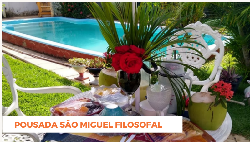
POUSADA SÃO MIGUEL FILOSOFAL