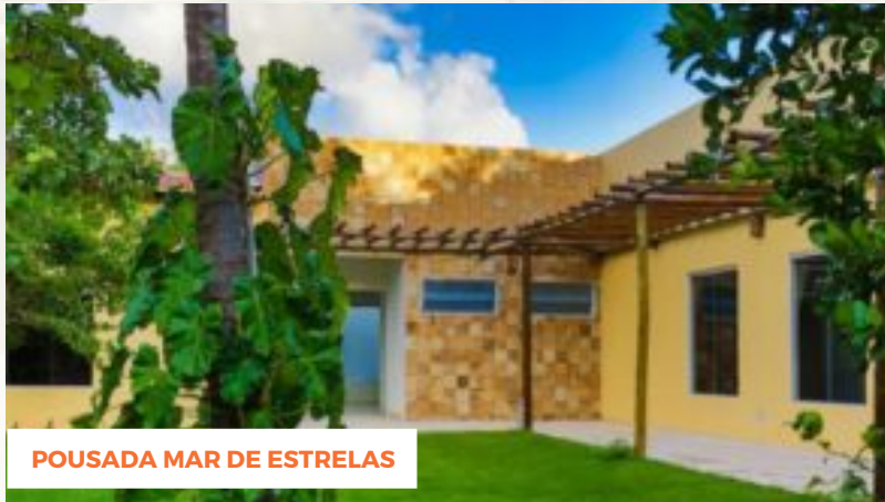
POUSADA MAR DE ESTRELAS