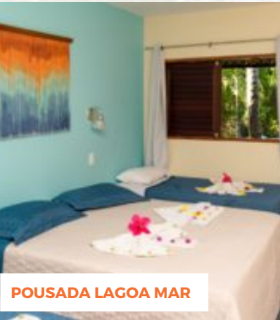
POUSADA LAGOA MAR