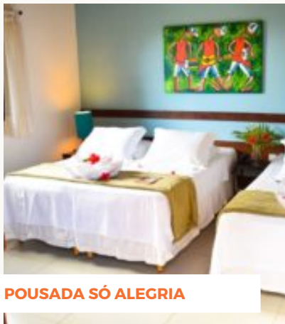
POUSADA SÓ ALEGRIA