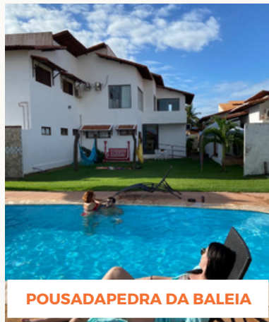
POUSADA PEDRA DA BALEIA