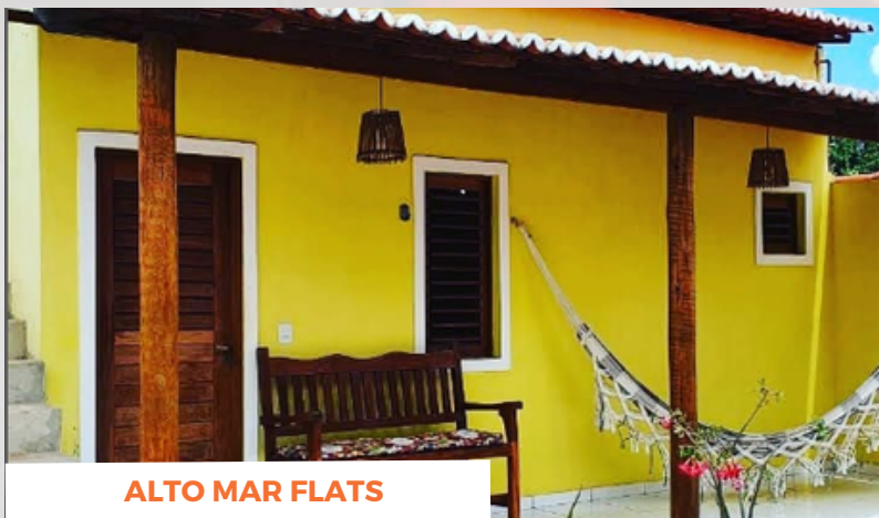
ALTO MAR FLATS