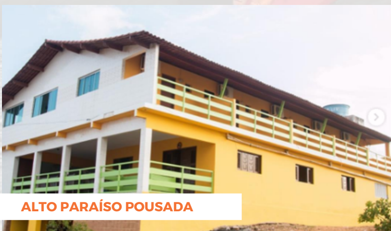
ALTO PARAÍSO POUSADA