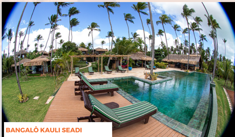
BANGALÔ KAULI SEADI