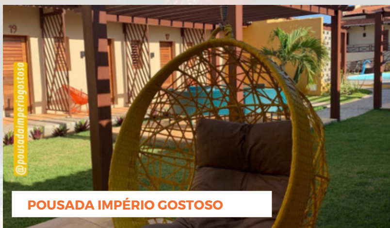
POUSADA IMPÉRIO GOSTOSO