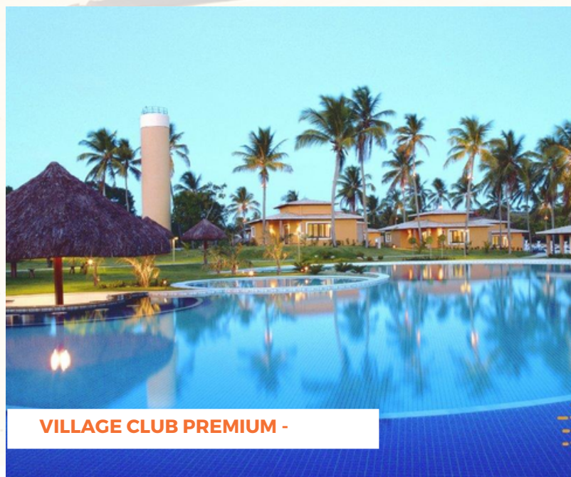
VILLAGE CLUB PREMIUM -