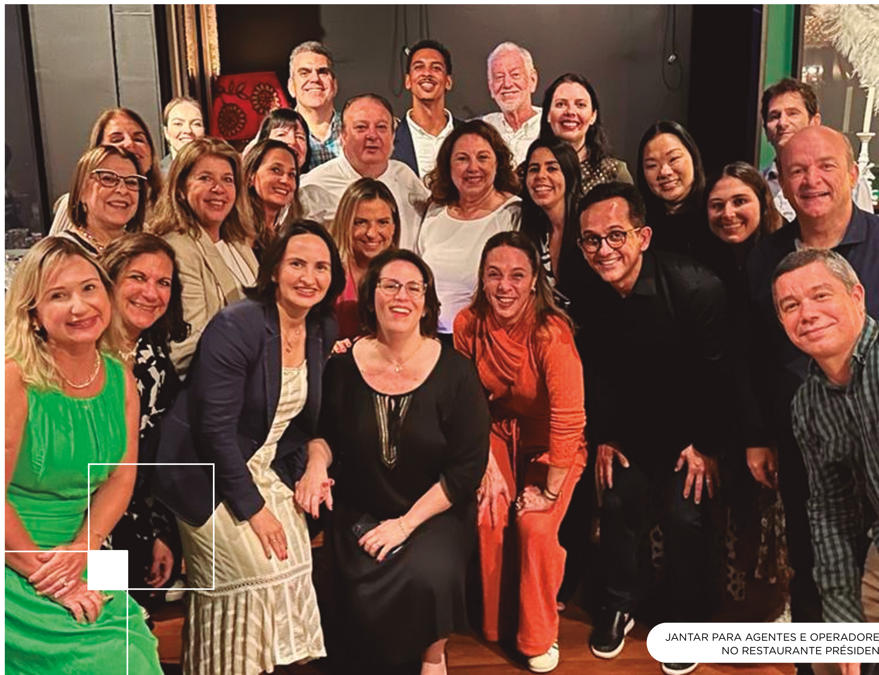
JANTAR PARA AGENTES E OPERADORES NO RESTAURANTE PRÉSIDENT

O maior evento dedicado ao mercado de luxo da América Latina contou com a participação dos hoteleiros potiguares, na oportunidade, a ABIH-RN, em parceria com a Prefeitura de Natal, realizou um jantar de divulgação e promoção do destino para 25 agentes de viagens do segmento luxo. A ação foi realizada na quarta-feira (10), no Restaurante Président - Chef Érick Jacquin.