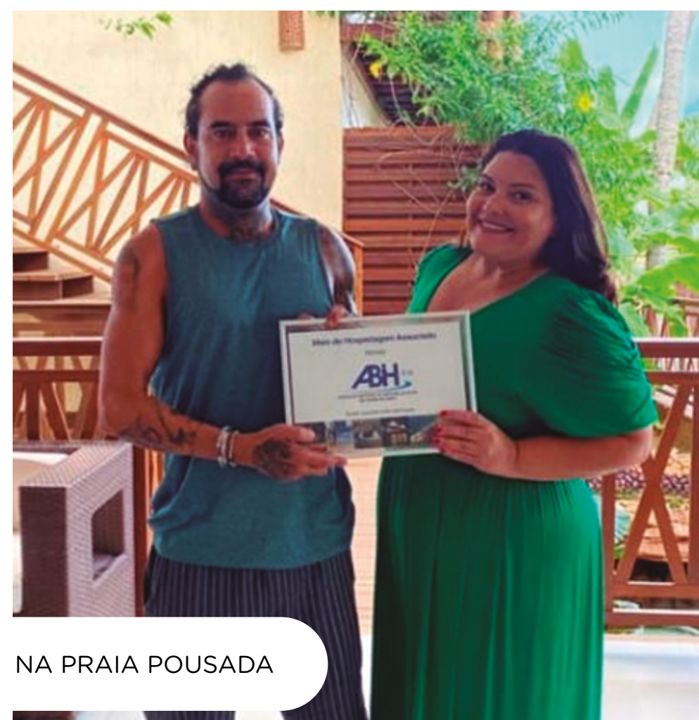
NA PRAIA POUSADA