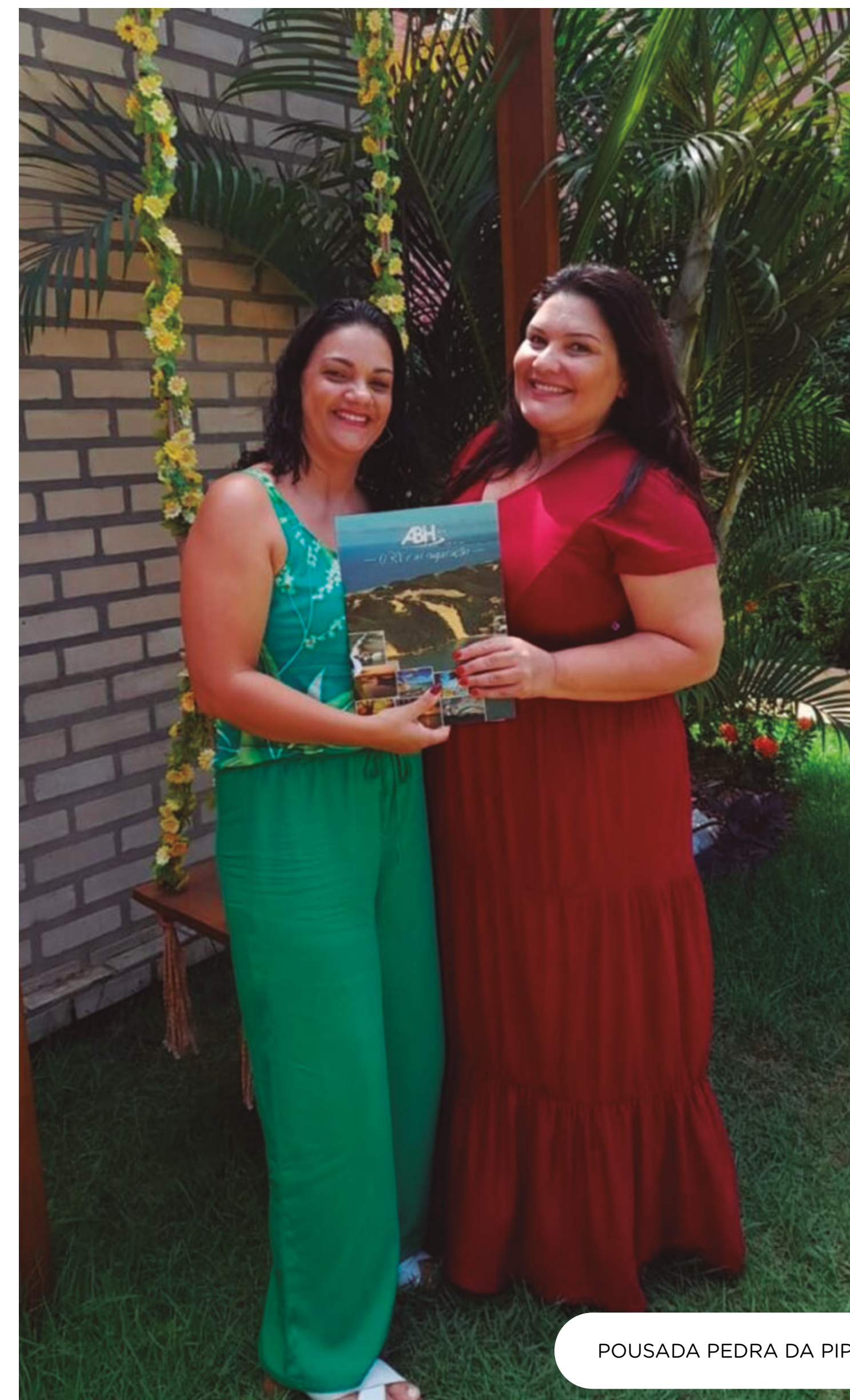
POUSADA PEDRA DA PIPA