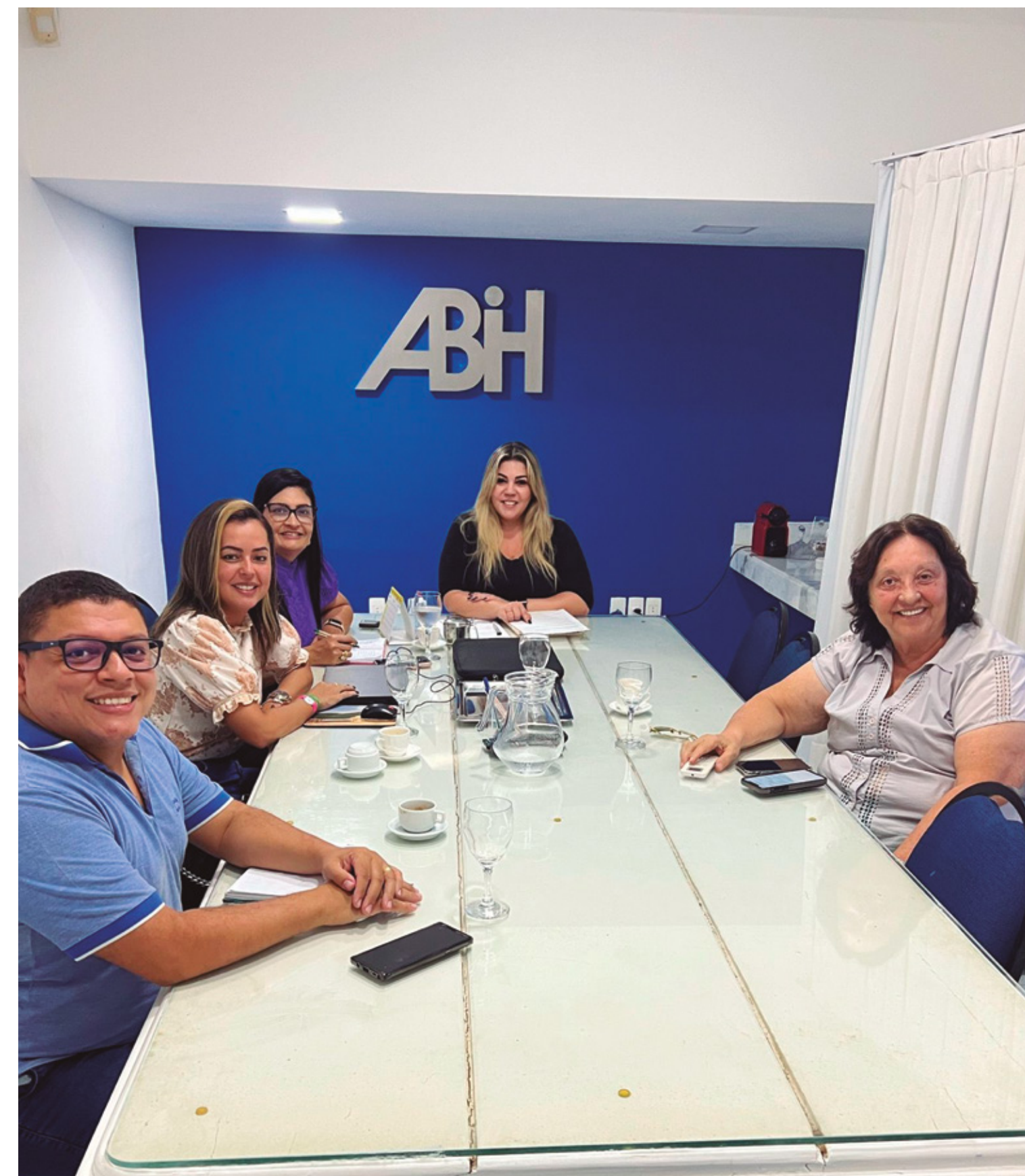
ABIH-RN RECEBE A NOVA GERENTE DE PRODUTOS RIO GRANDE DO NORTE DA CVC