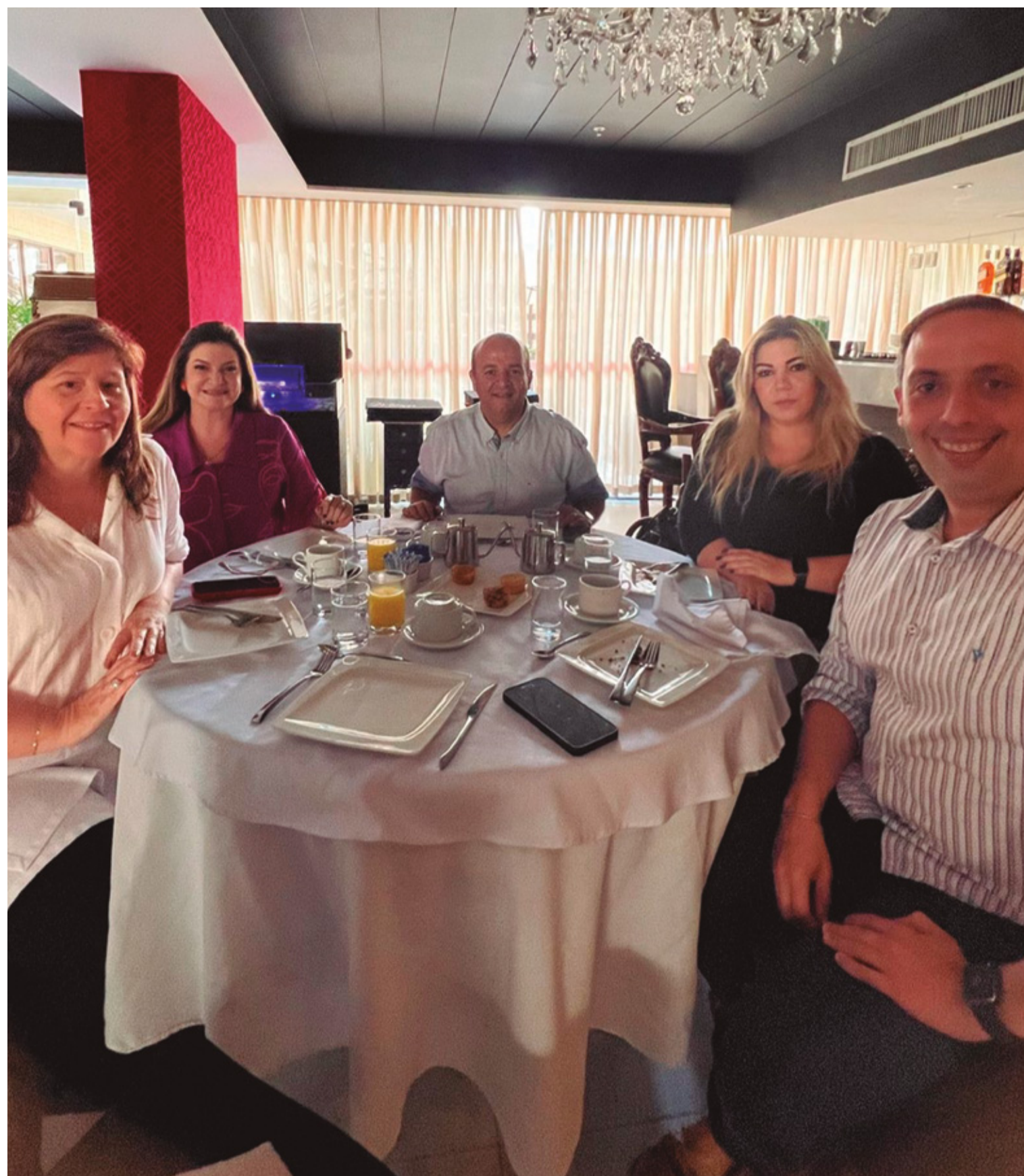
ABIH-RN SE REÚNE COM SEMTAS