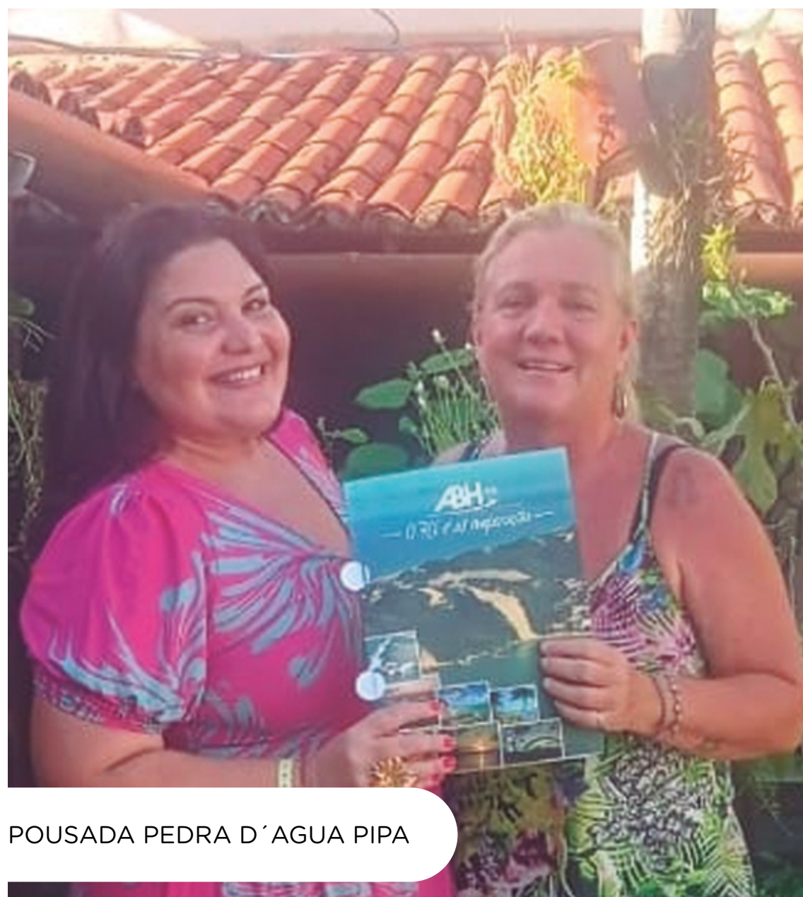
POUSADA PEDRA D'ÁGUA PIPA