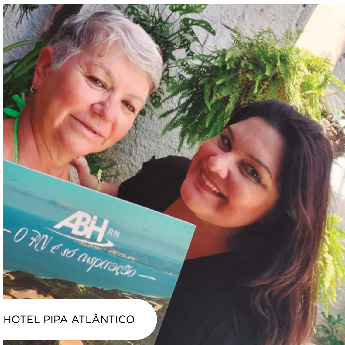
HOTEL PIPA ATLÂNTICO