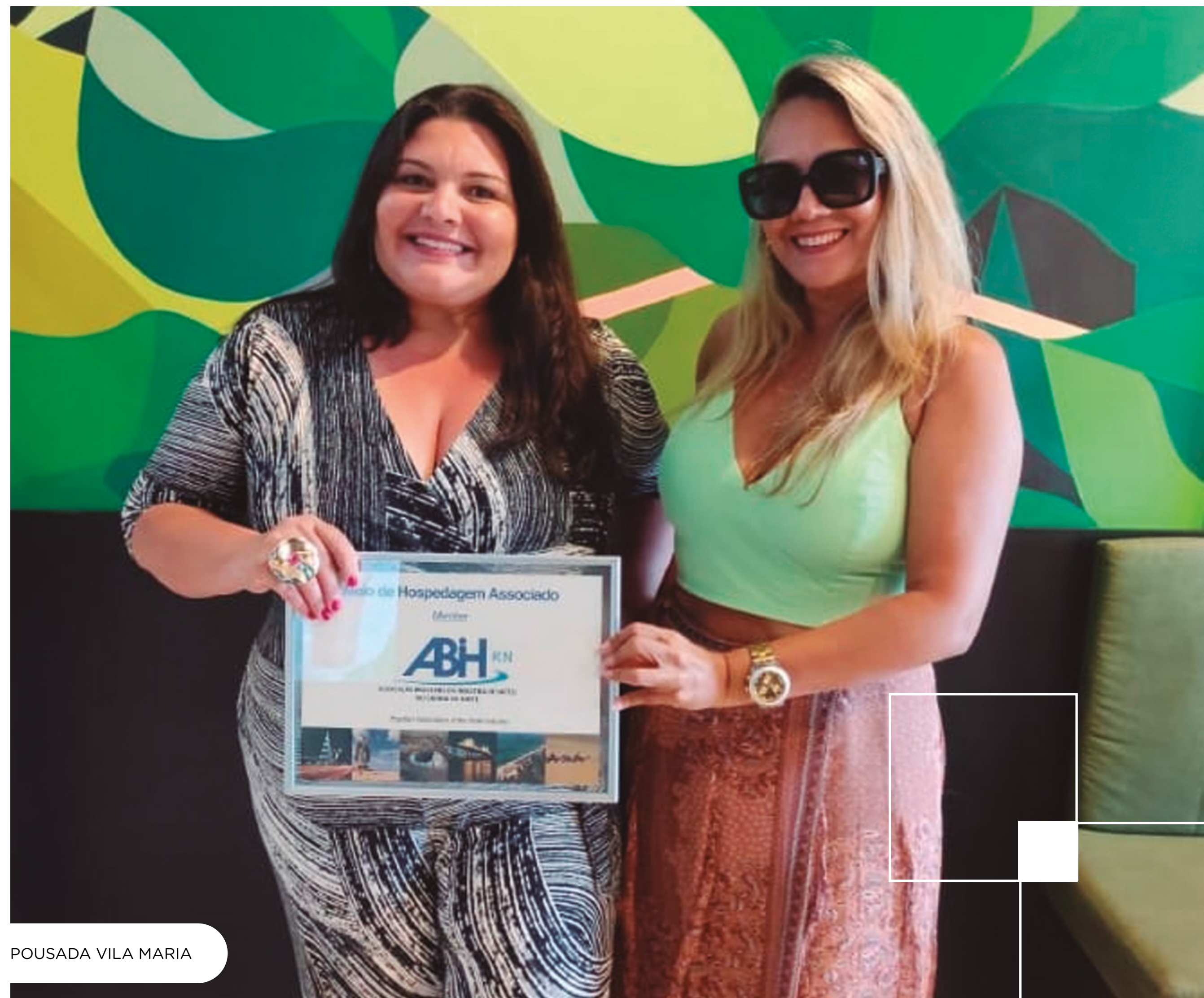
POUSADA VILA MARIA