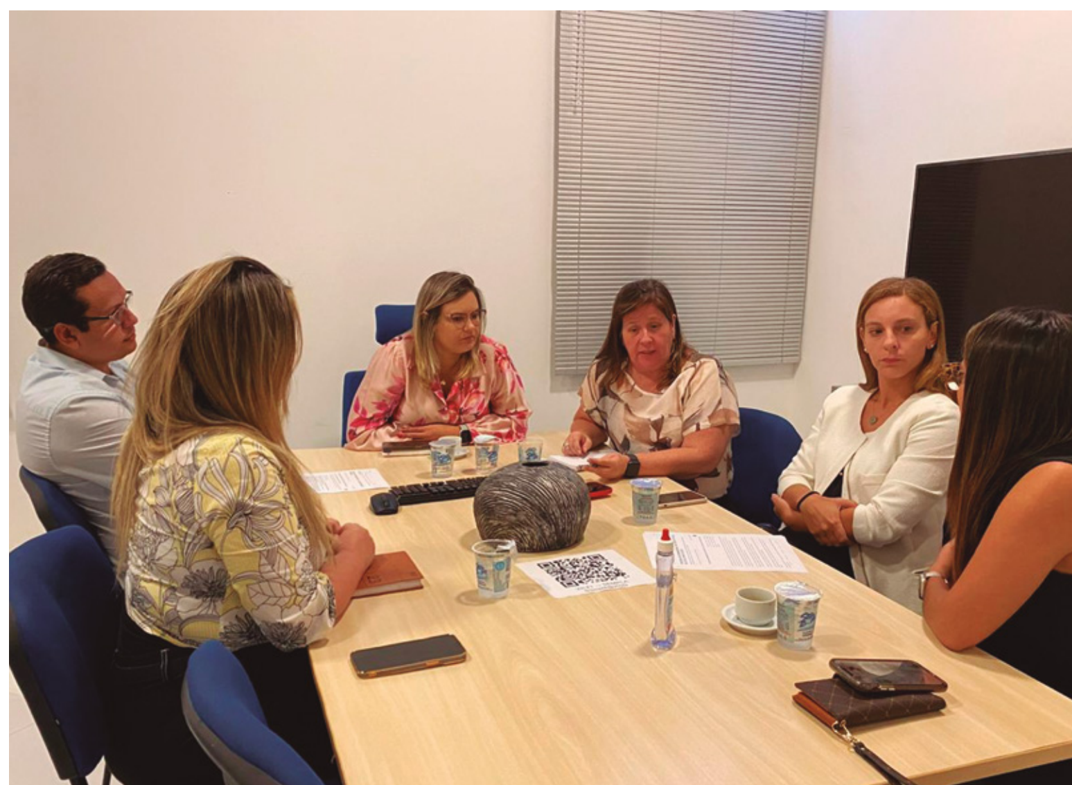
ABIH-RN SE REÚNE COM SEPLAN E SETUR