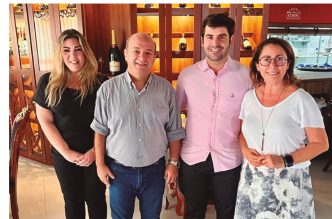
HOTELARIA E TURISMO EM PAUTA