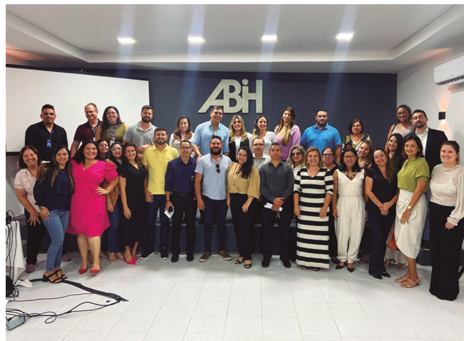
ABIH-RN REALIZA REUNIÃO DE PLANEJAMENTO PARA SEGUNDO SEMESTRE