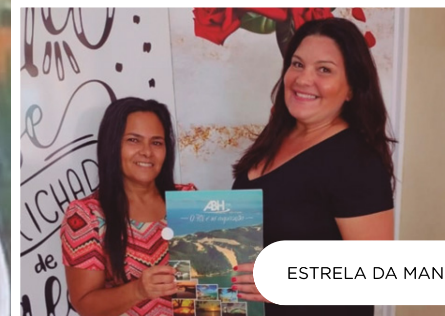
ESTRELA DA MANHÃ