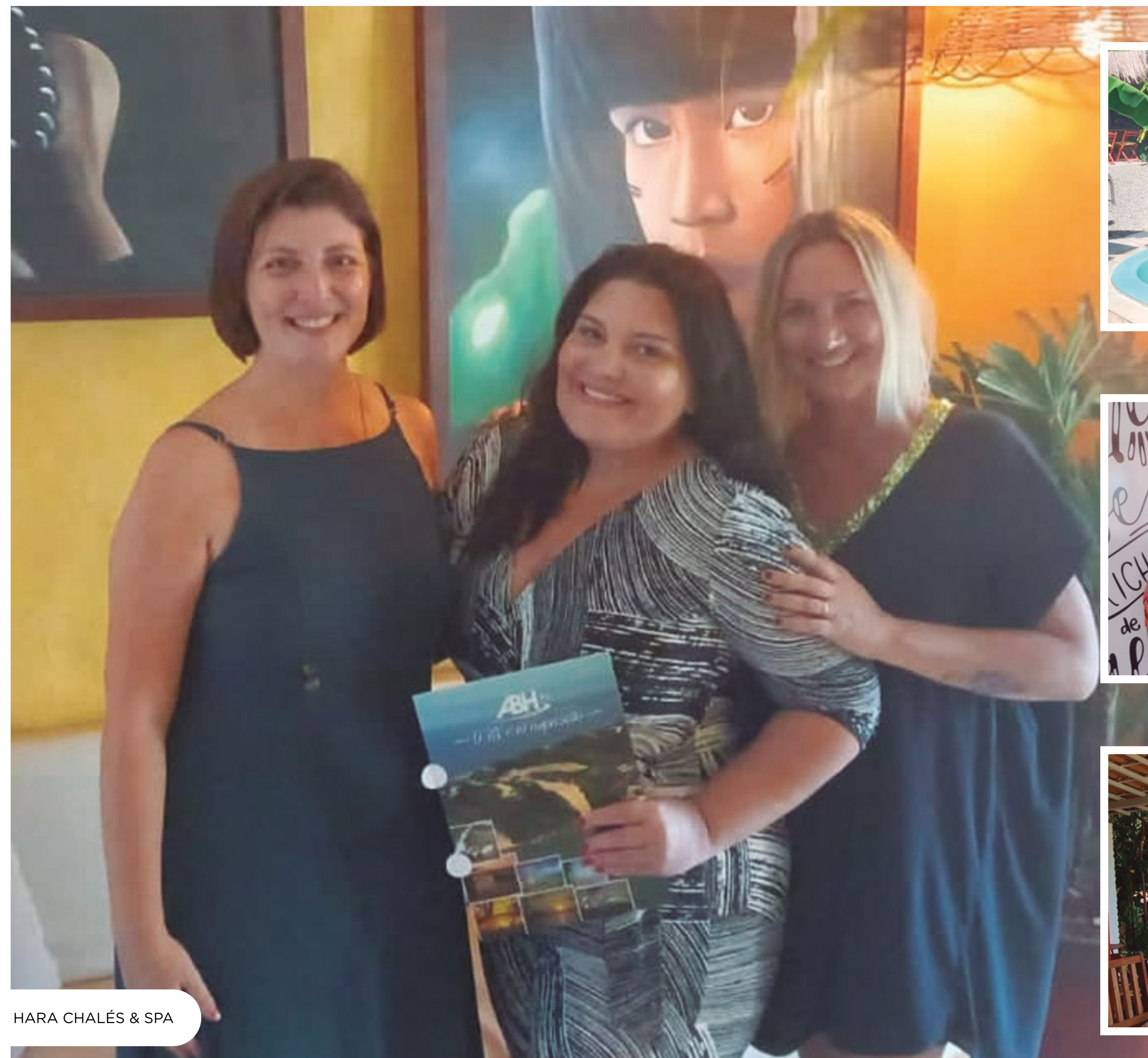
HARA CHALÉS & SPA