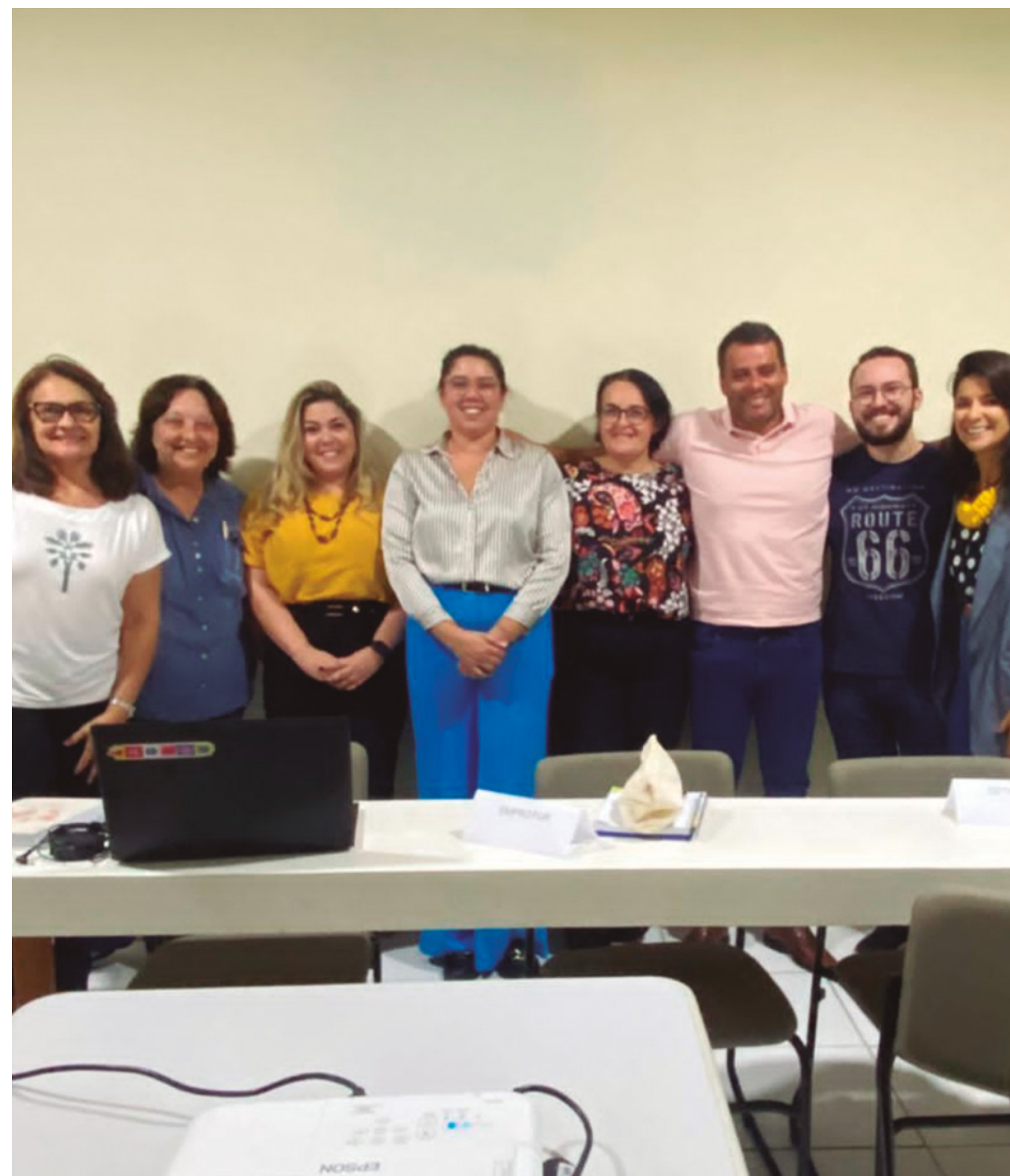
ABIH-RN PARTICIPA DE LANÇAMENTO DE NOVA CAMPANHA DE MARKETING DO RIO GRANDE DO NORTE