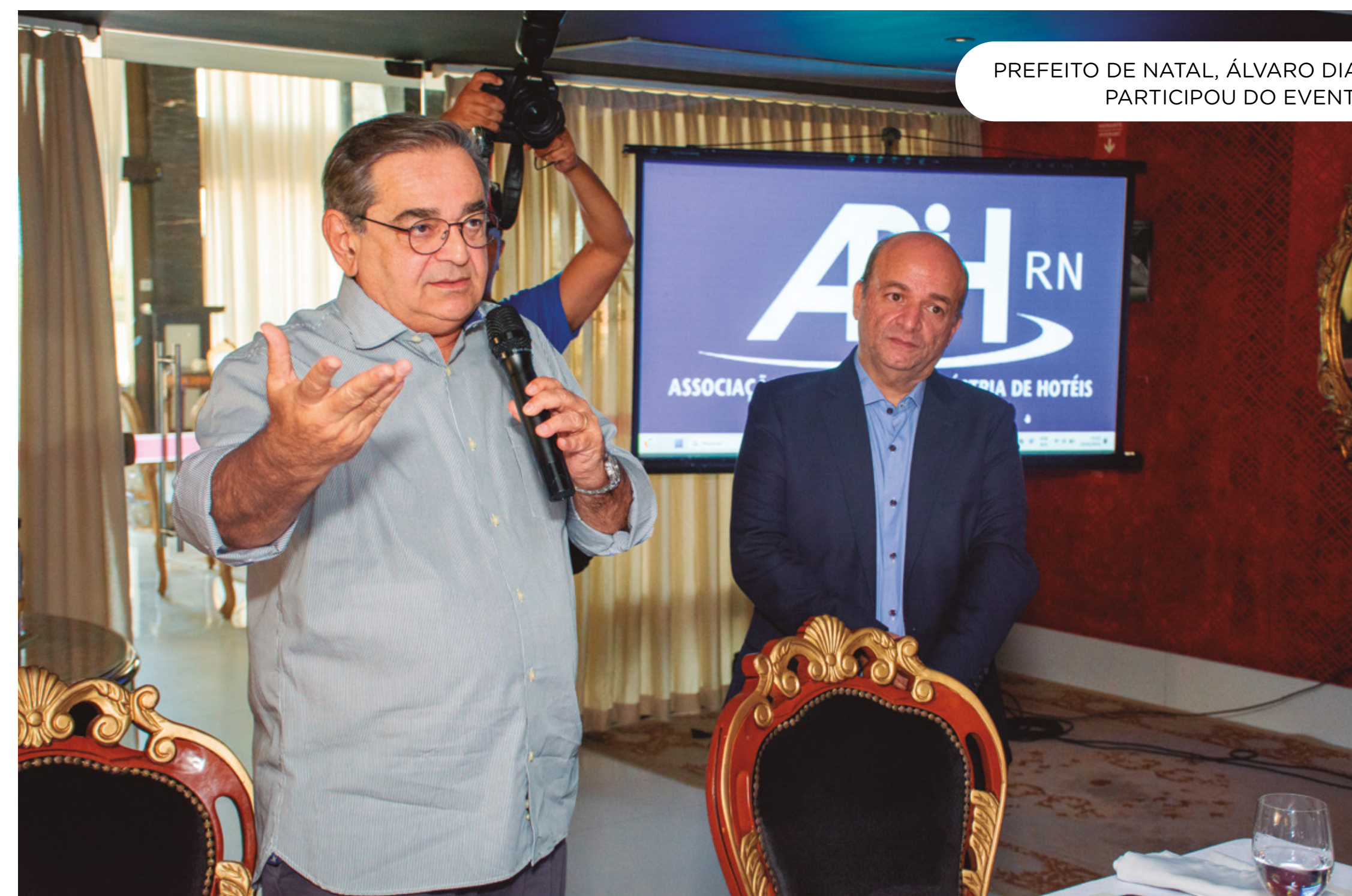
PREFEITO DE NATAL, ÁLVARO DIAS PARTICIPOU DO EVENTO

O prefeito de Natal, Álvaro Dias esteve no evento e destacou as ações. “O turismo é a principal atividade econômica geradora de emprego e renda para nossa cidade. Temos através do turismo, bares, pousadas, restaurantes, hotéis trazendo renda para Natal. Portanto, cada vez mais se fortalece a parceria entre o município e a ABIH-RN, no sentido de divulgar nossas belezas naturais, pois assim vamos atrair mais visitantes para conhecer a bela cidade de Natal”, destacou o prefeito de Natal.