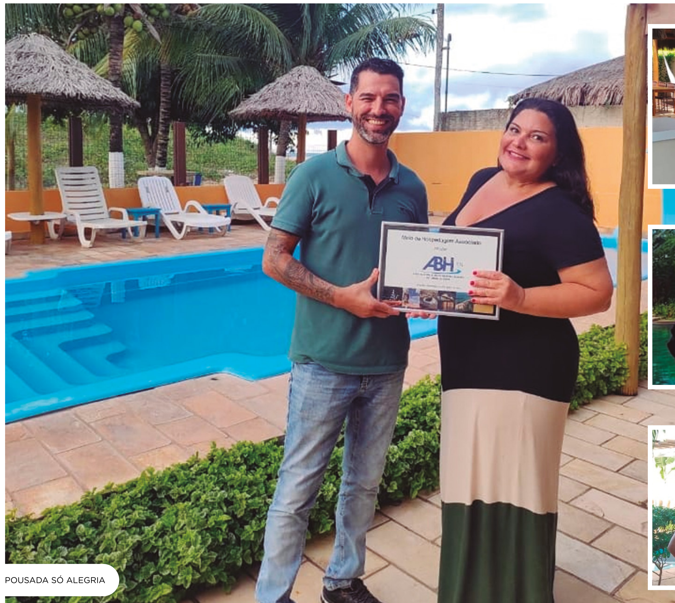
POUSADA SÓ ALEGRIA