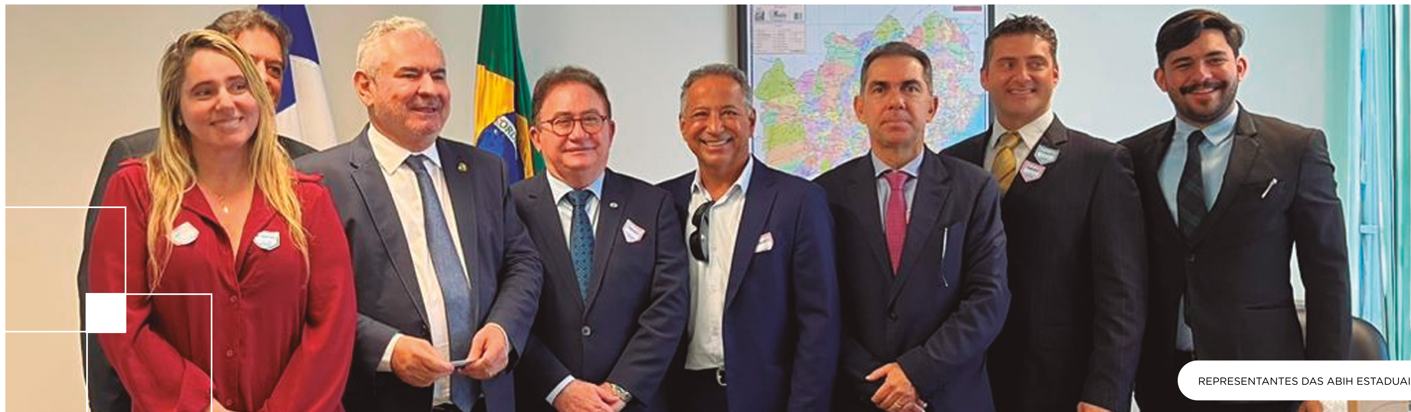
REPRESENTANTES DAS ABIH ESTADUAIS