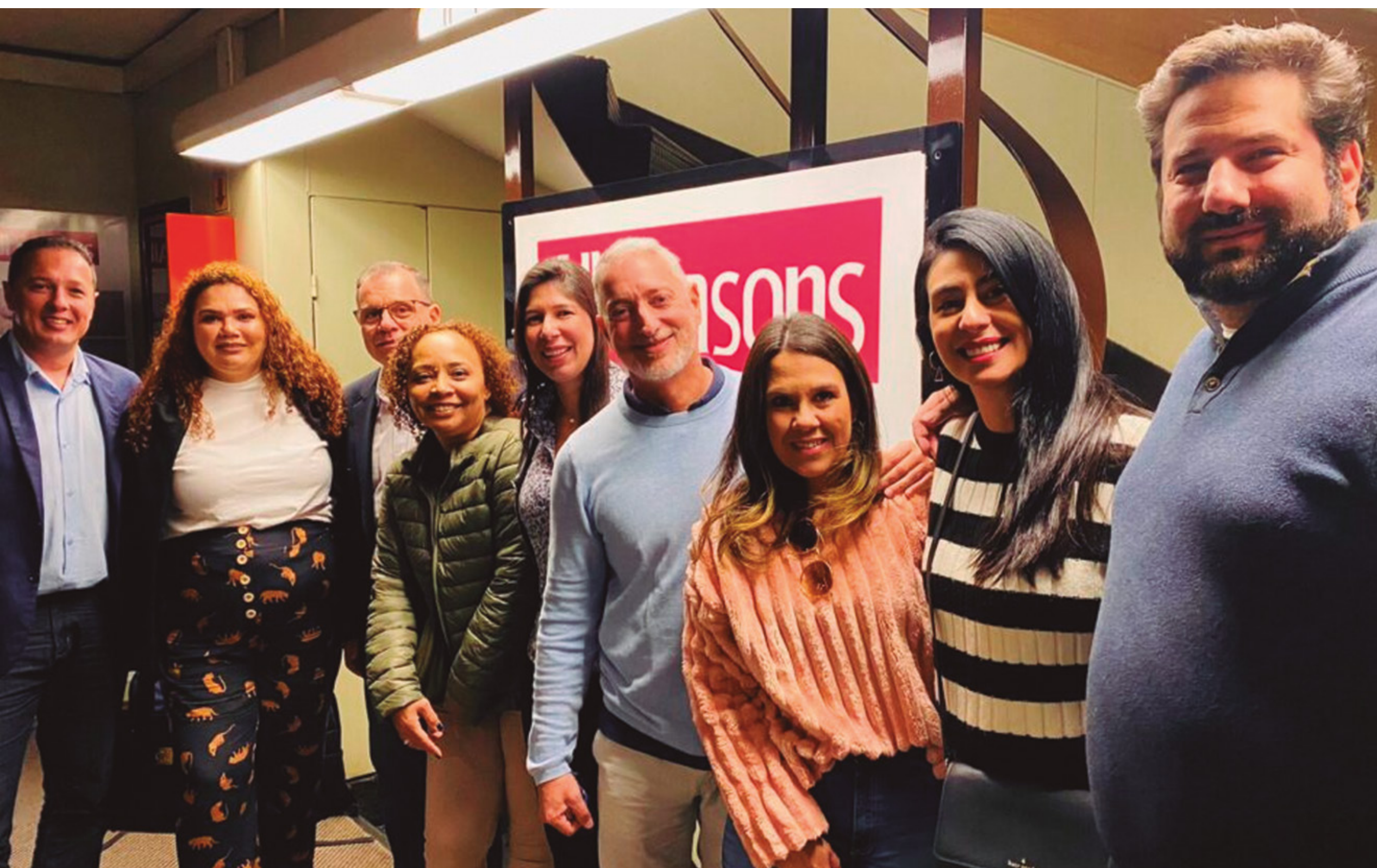
VISITA A OPERADORA ALL SEASONS EM BUENOS AIRES