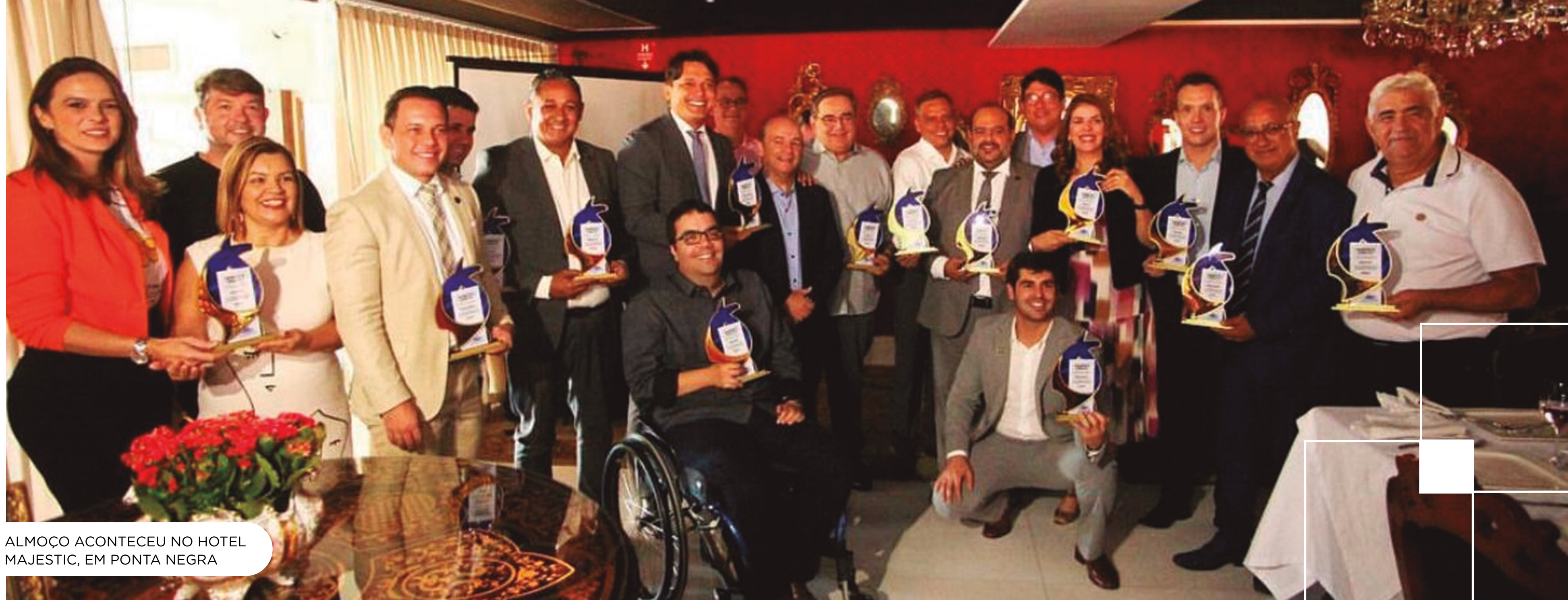
ALMOÇO ACONTECEU NO HOTEL MAJESTIC, EM PONTA NEGRA