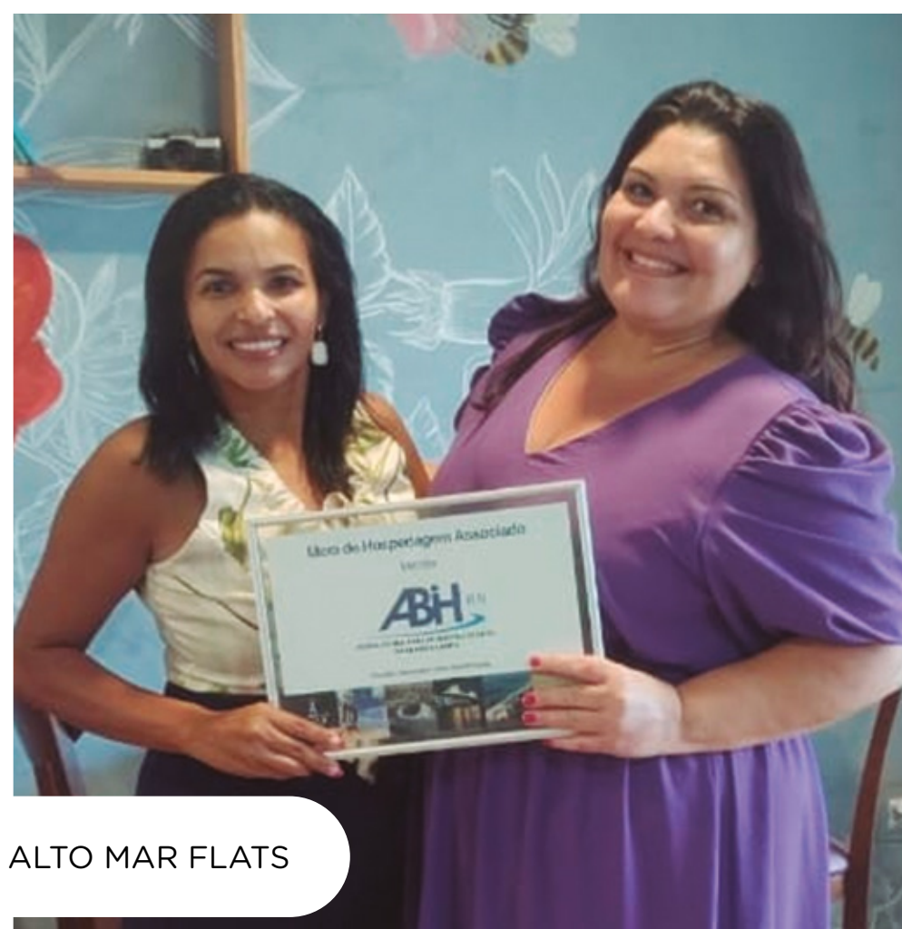
ALTO MAR FLATS

Um dos destinos mais procurados para o réveillon, São Miguel do Gostoso - a 100 quilômetros de Natal é uma das praias mais visitadas por famosos e anônimos durante o ano inteiro. As pousadas de charme ou de luxo são as mais buscadas pelos turistas que buscam sossego e boa gastronomia.