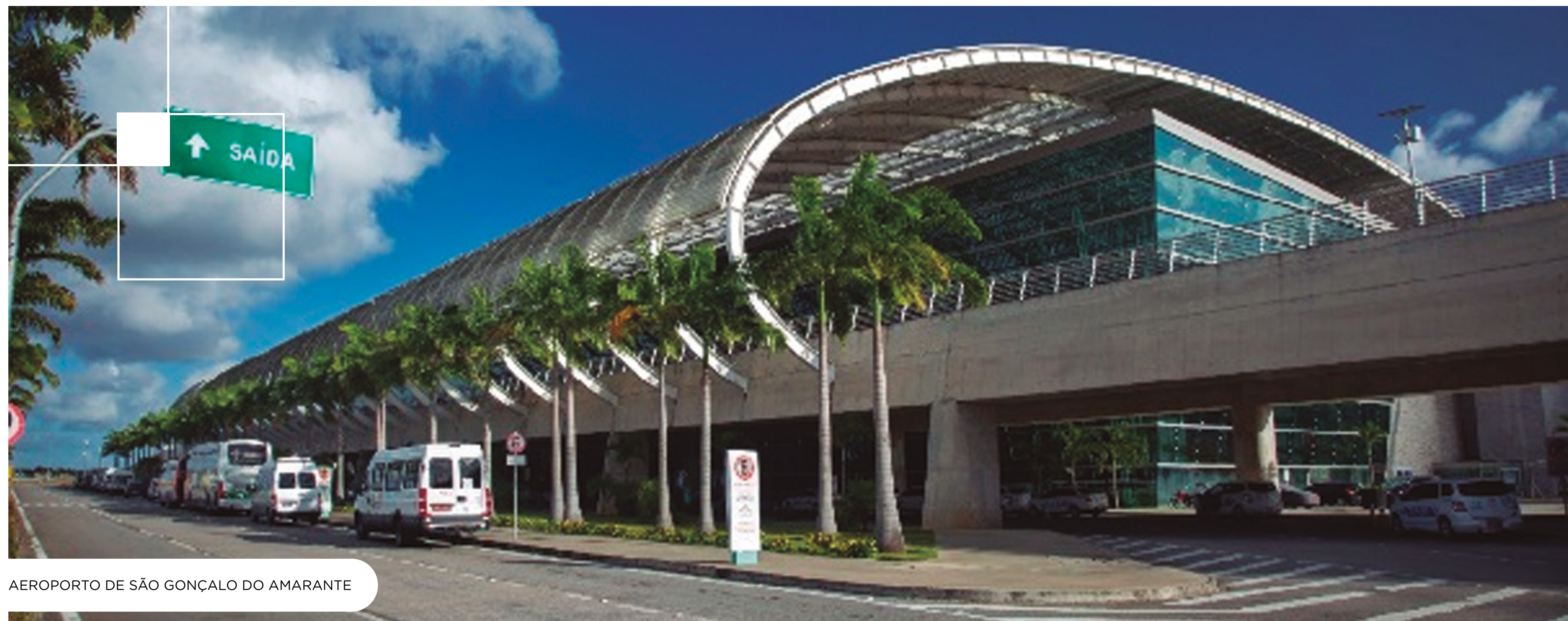
AEROPORTO DE SÃO GONÇALO DO AMARANTE