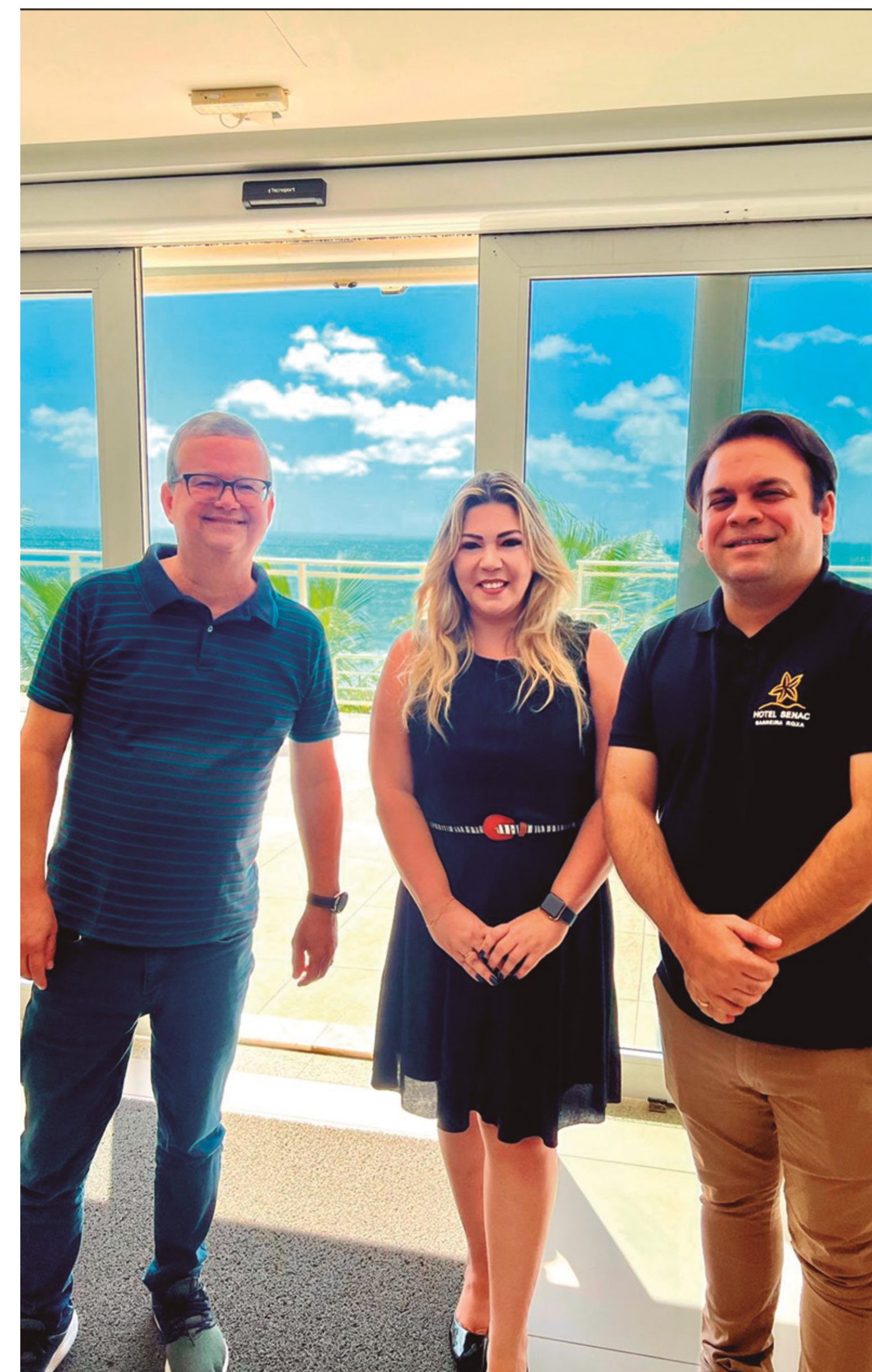
ABIH-RN SE REÚNE COM REPRESENTANTE DE EMPRESA DE SOFTWARE