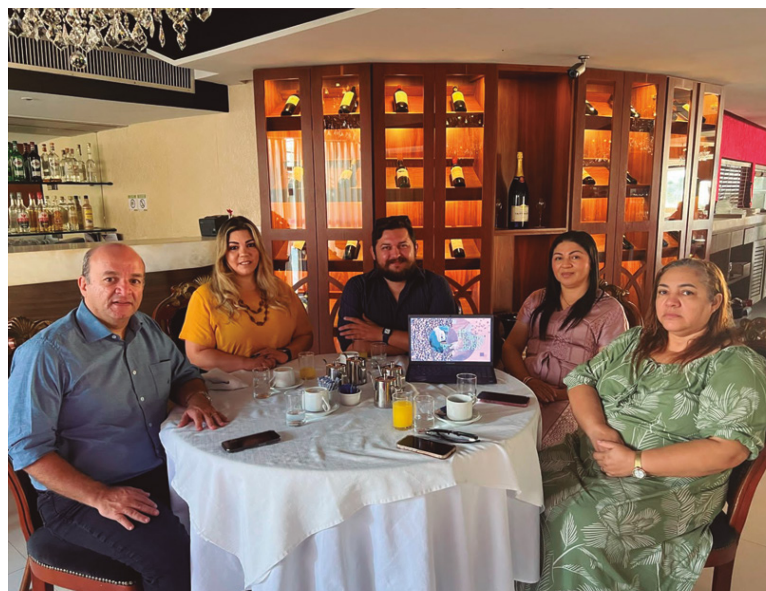
ABIH-RN RECEBE OS IDEALIZADORES DO I FESTIVAL DO CAFÉ DO RIO GRANDE DO NORTE