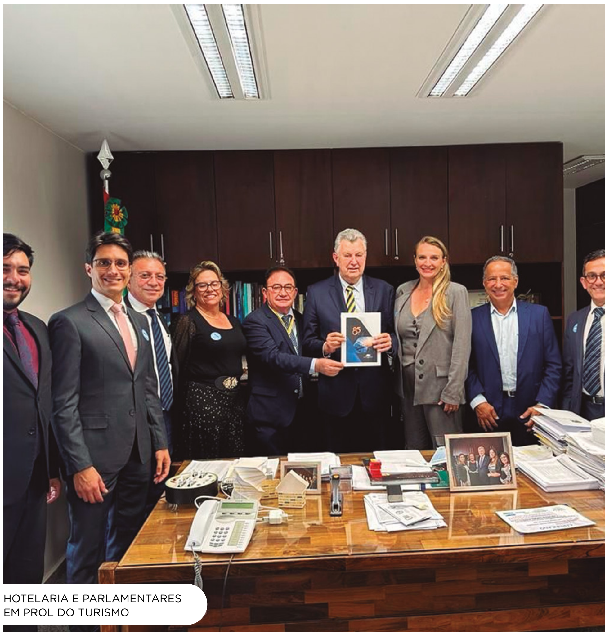
HOTELARIA E PARLAMENTARES EM PROL DO TURISMO