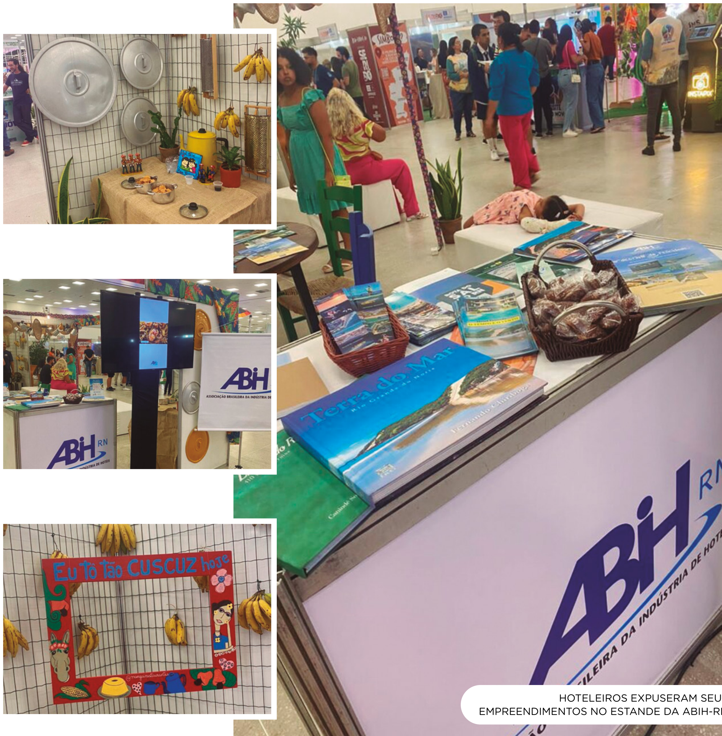
HOTELEIROS EXPUSERAM SEUS EMPREENDIMENTOS NO ESTANDE DA ABIH-RN

No espaço reservado para a ABIH-RN, os hoteleiros puderam mostrar seus produtos e equipamentos. A feira recebeu caravanas de Pernambuco e Paraíba, além de visitantes de todo o estado. O presidente da associação comentou sobre a importância da Femptur para o turismo.