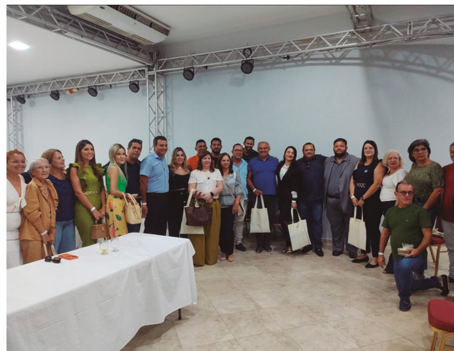
ABIH-RN PARTICIPA DA REUNIÃO COMISSÃO DE TURISMO DO POLO COSTA DAS DUNAS