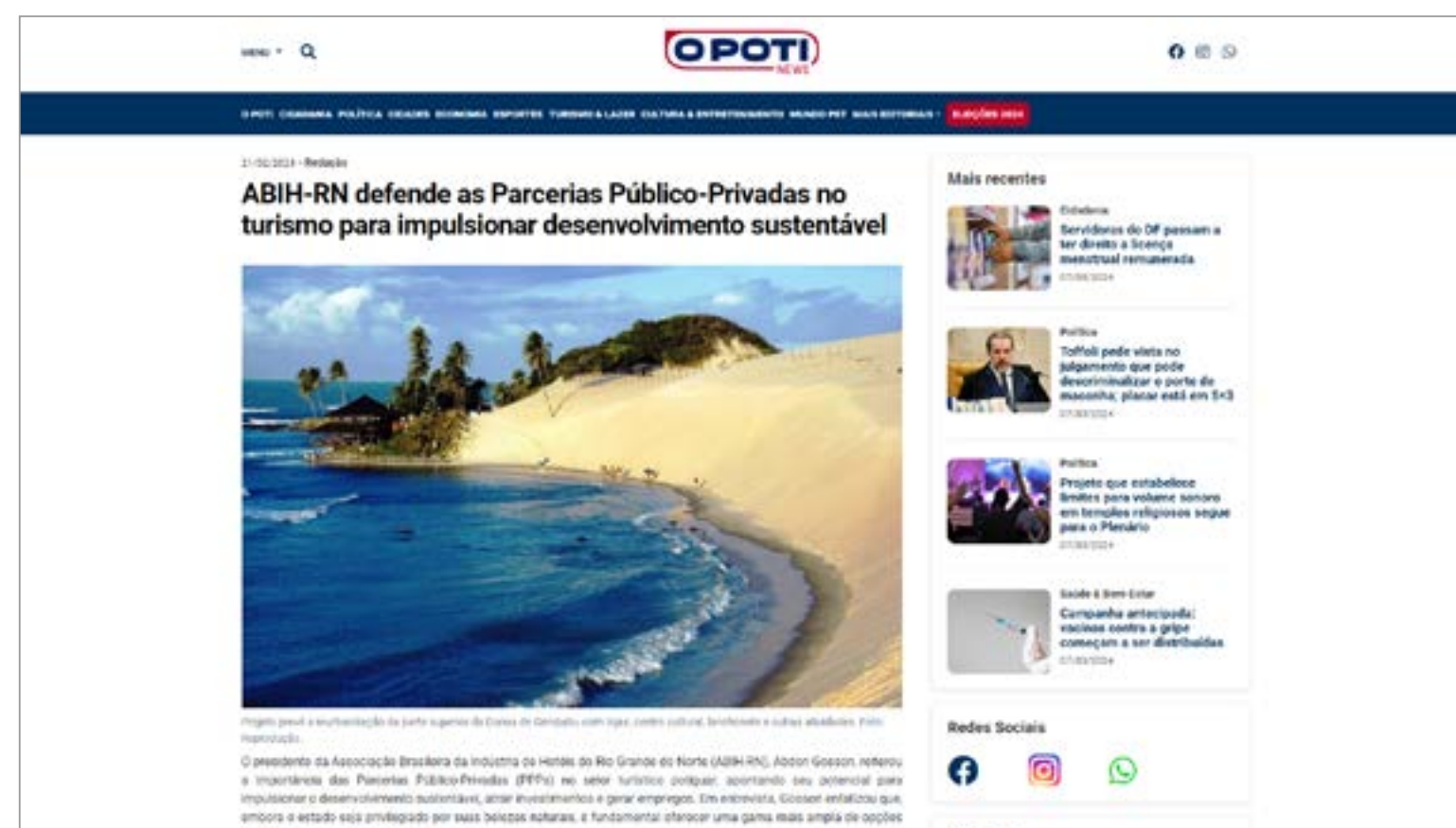
ABIH-RN defende as Parcerias Público-Privadas no turismo para impulsionar desenvolvimento sustentável: https://opot.com.br/abih-rn-defende-as-parcerias-publico-privadas-no-turismo-para-impulsionar-desenvolvimento-sustentavel/sobre-a-ocupacao-para-o-verao-2024/