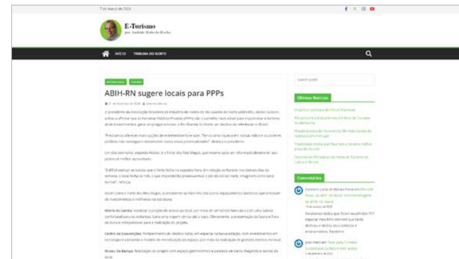
ABIH-RN sugere locais para PPPs: https://blog.tribunadonorte.com.br/eturismo/abih-rn-sugere-locais-para-ppps/