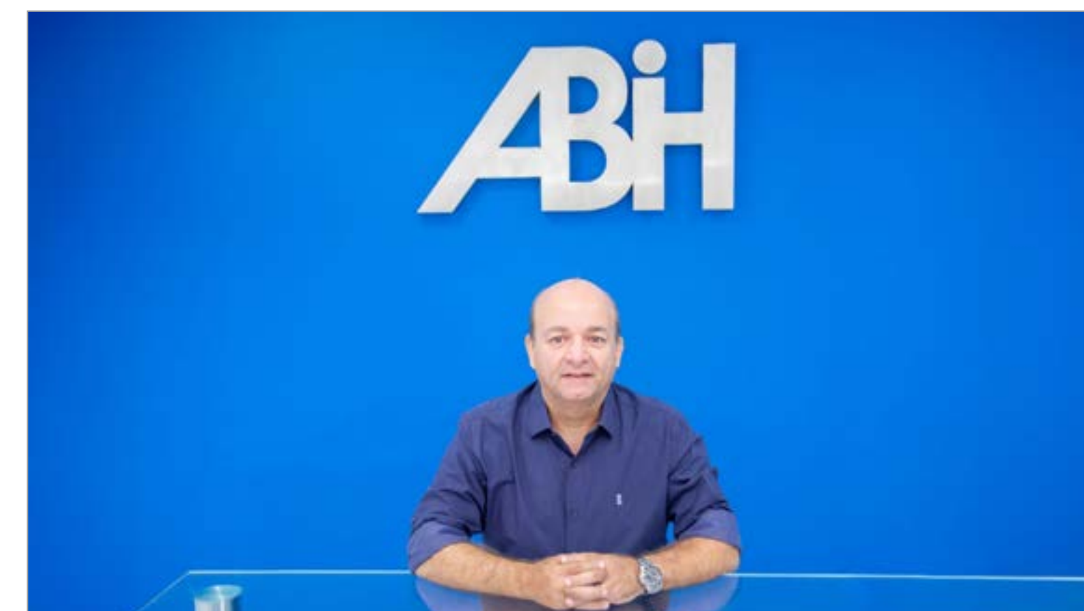
ABIH-RN Defende As Parcerias Público-privadas No Turismo: https://www.blogjosepatricio.com/post/abih-rn-defende-as-parcerias-público-privadas-no-turismo