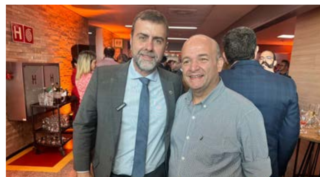
PRES DA ABIH-RN, ABDON GOSSON E O PRESIDENTE DA EMBRATUR, MARCELO FREIXO.

Para os primeiros meses de operação, a Zurich Airport Brasil prevê investimento de cerca de R$3 milhões em melhorias na infraestrutura, segurança, área comercial e experiência do passageiro. Além disso, já está em vigor uma nova tabela de estacionamento - com redução na ordem de 30% no valor da diária, saindo de R$ 56 para R$ 39,00 para a primeira diária. O contrato para a primeira sala vip do aeroporto já foi assinado e haverá a operação na área doméstica e internacional.