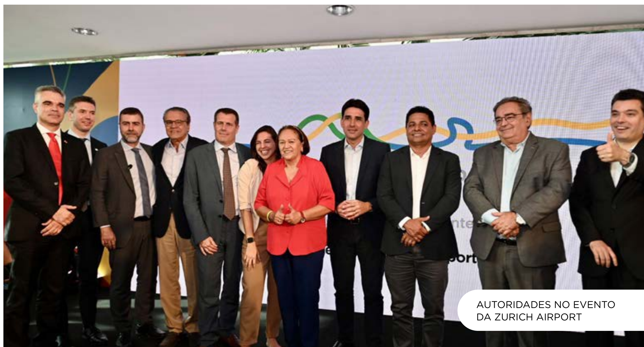
AUTORIDADES NO EVENTO DA ZURICH AIRPORT