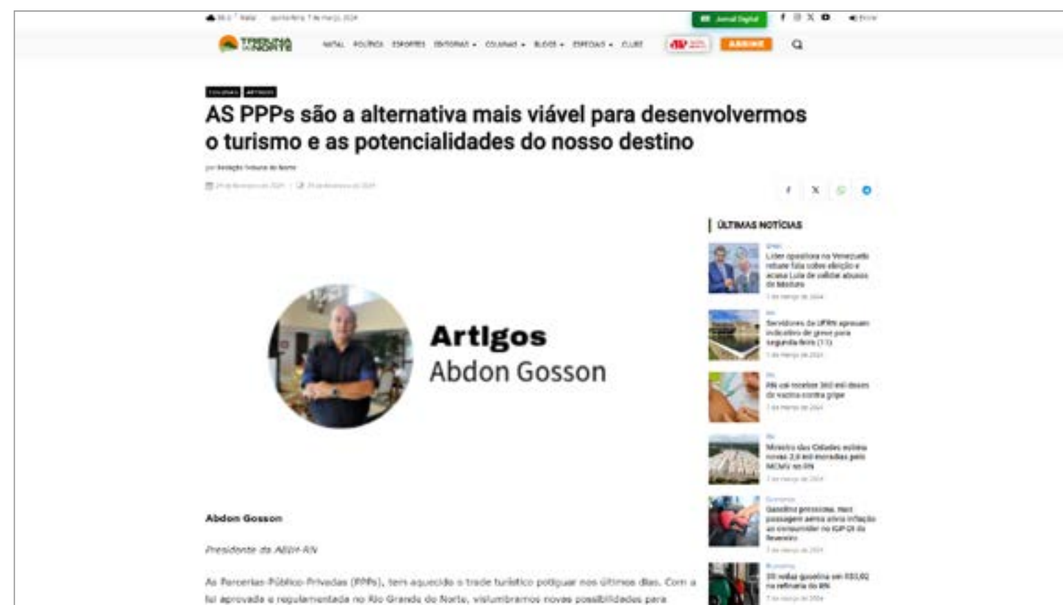
AS PPPs são a alternativa mais viável para desenvolvermos o turismo e as potencialidades do nosso destino: https://tribunadonorte.com.br/colunas/as-ppps-sao-a-alternativa-mais-viavel-para-desenvolvermos-o-turismo-e-as-potencialidades-do-nosso-destino/